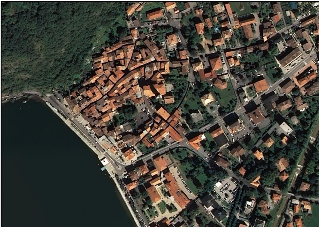
ORTOFOTO DEL CENTRO STORICO DI PORLEZZA