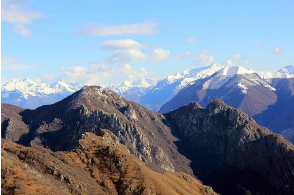
monte bronzone 1434 m

La fascia dei boschi e dei maggenghi è compresa tra i 700 ed i 1.000 m. di quota ed è caratterizzata da un alternarsi di prati e di boschi.